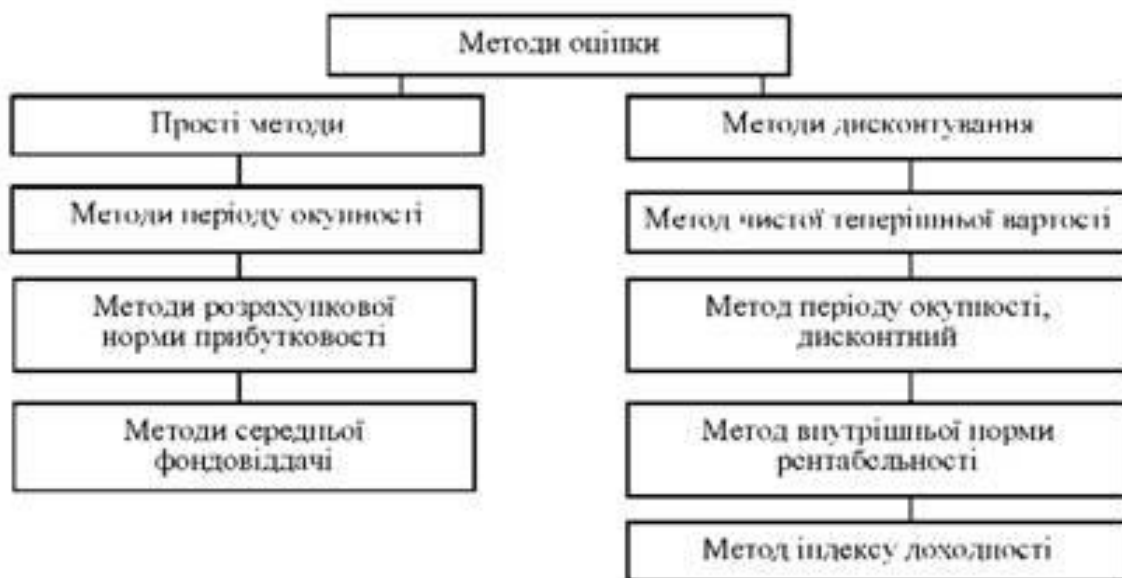
Рис. 4 - Методи оцінки доцільності капіталовкладень[3]

З'ясовуючи доцільність і привабливість інвестиційного проекту застосовують ряд методів (рис. 4).