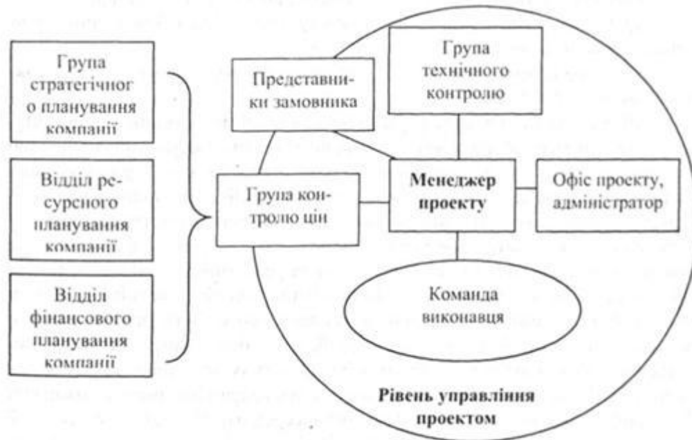
Рис. 1- Приклад організації проекту

Посади основних членів команди проекту відрізняються залежно від типу проекту. Для промислового проекту, наприклад, у ядро команди, крім менеджера проекту, повинен входити головний інженер проекту, який відповідає за специфікації та якість кінцевого продукту.