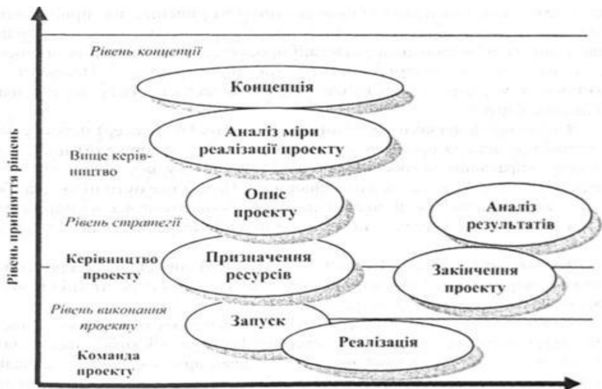
Рис. 3 - Роль різних рівнів організаційної структури проекту у прийнятті рішень на різних стадіях проектного циклу

Найчастіше використовується такі схеми управління проектами: "основна" схема; схема "розширеного управління"; схема "під ключ".[1] При виборі найбільш прийнятної форми, з точки зору умов реалізації проекту, необхідно врахувати такі фактори: складність проекту; технологічність проекту, тобто можливість виконання робіт з мінімальними витратами трудових, матеріальних та фінансових ресурсів; строки завершення окремих стадій; вимоги замовника (інвестора); фінансові можливості замовника (інвестора).